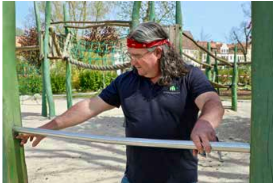
... prüft die Geräte auf dem Spielplatz und ...