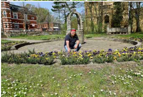
2019 hat die KSW insgesamt mehr als 3.000 Stiefmütterchen auf städtischen Grünflächen gepflanzt.