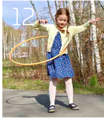
Mit Reifen, Ball und Kreide raus ins Freie.